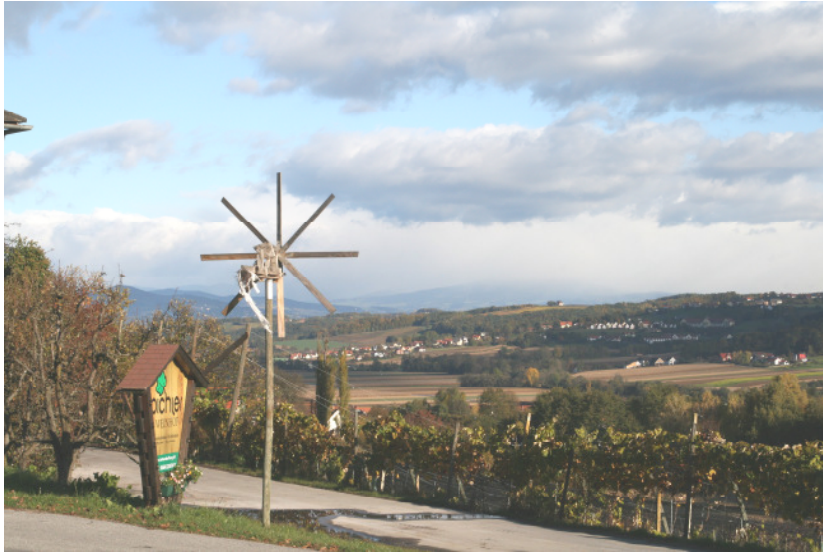
Unser schöner Ausblick ...

herzli` Wüllkommen und wir wünschen Eich an g`sund`n Appetit , damit` s de vül`n guat`n Soch`n de wos mir Eich glei` auftisch`n a olle da-ess`n mägts.